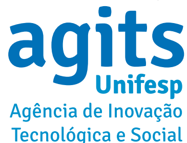
Versão em monocromia - azul agits em escala

Assim, definimos versões da marca nas seguintes modalidades: