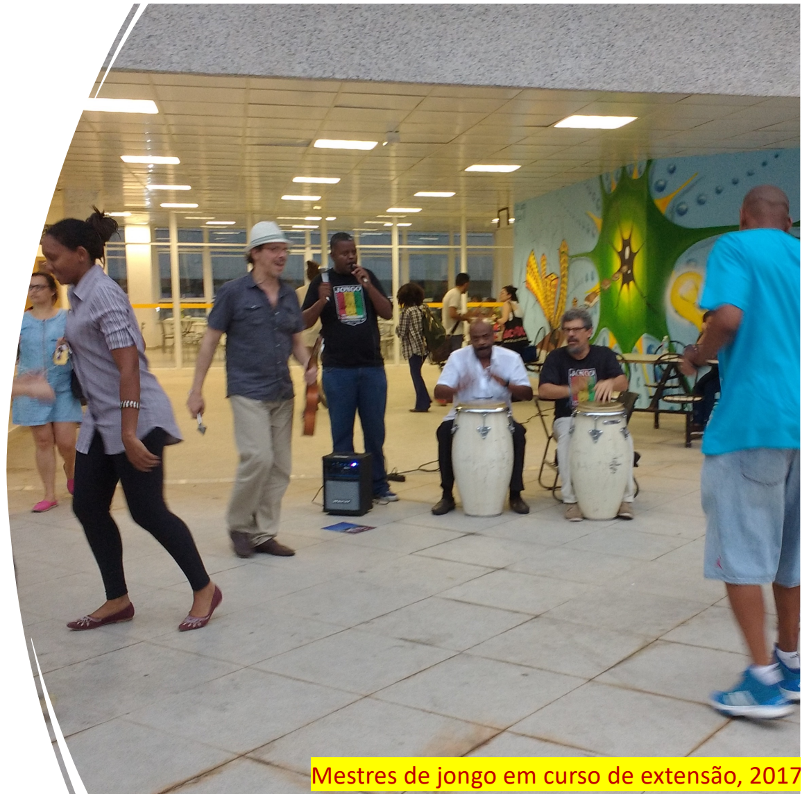
Mestres de jongo em curso de extensão, 2017