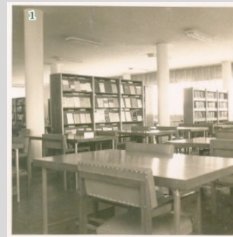
1- Vista do espaço interno Década de 1960, com a coleção de revistas