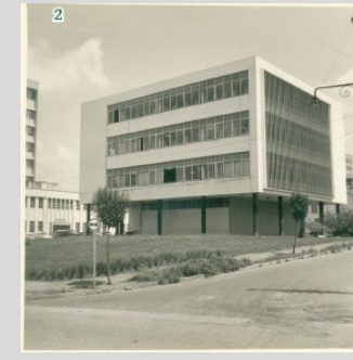
2 - Biblioteca da EPM - Vista da esquina da Rua Botucatu com Rua Loefgreen (Década de 1960), já com a ampliação do térreo com Rua Loefgreen (1961)