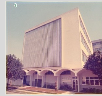
3 - Vista da esquina da Rua Botucatu com Rua Loefgreen (Década de 1970), já com a ampliação do térreo com a cobertura em abóbadas